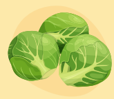
chou de bruselles