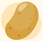
pomme de terre