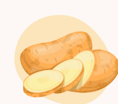
pomme de terre