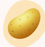
pomme de terre