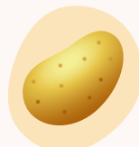
pomme de terre