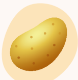
pomme de terre